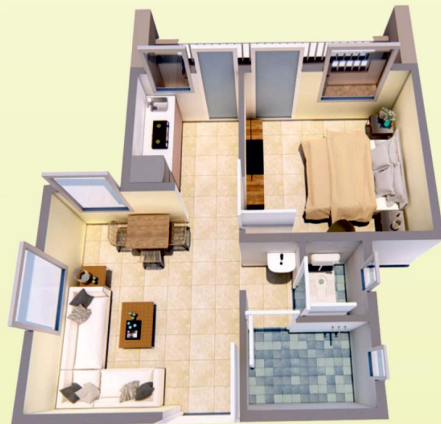
Type- I & II*